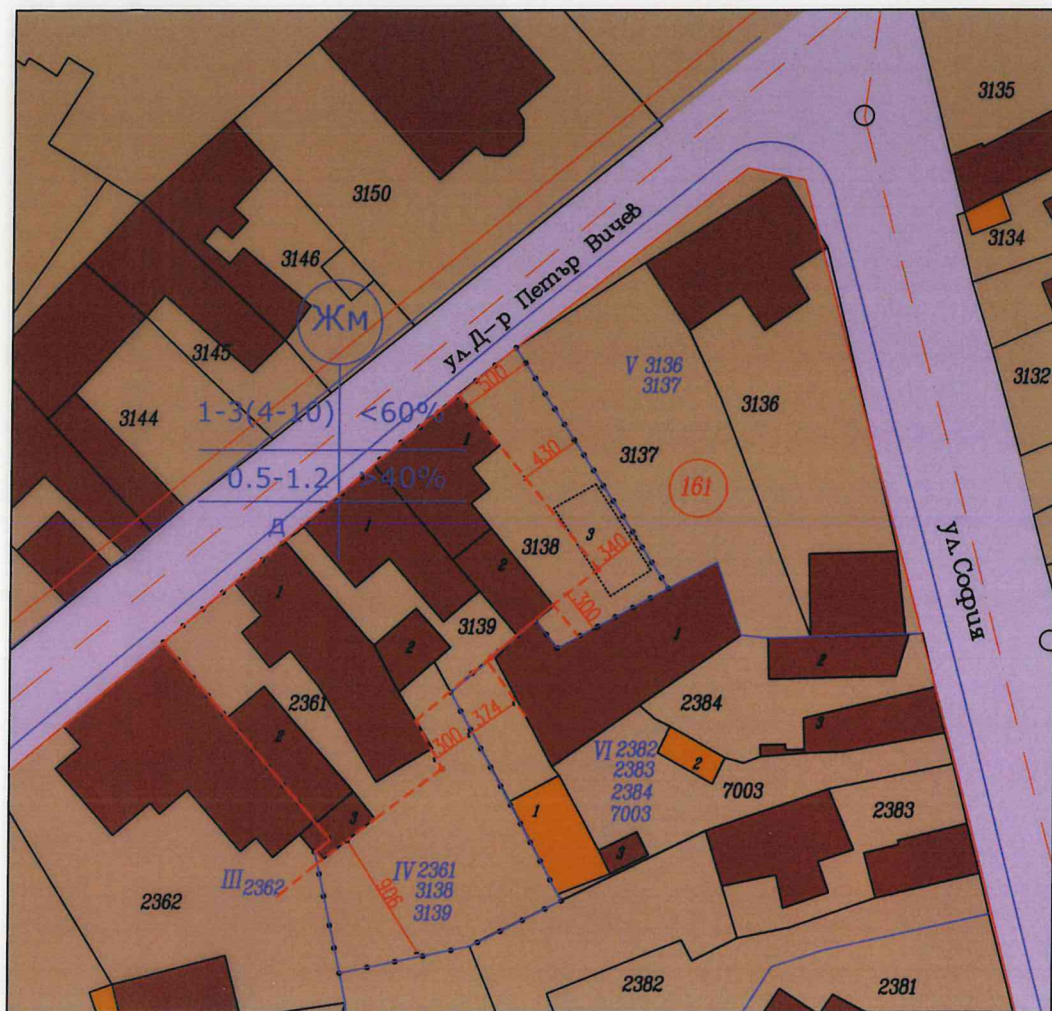
ПЛАН ЗА ЗАСТРОЯВАНЕ